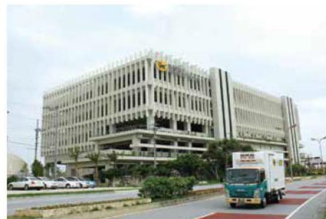
運用位於國際物流據點產業集積地域那霸地區4號棟內的「零件中心」

此外，相較於以亞洲各地為生產據點、各自分散保存維修零件的模式，以沖繩為庫存中心的集中式庫存具有壓縮庫存、降低成本的優點。